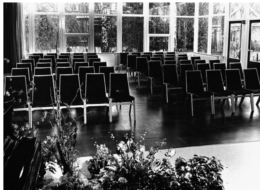
Gemeenschapszaal in het paviljoen

Begin jaren vijftig raakte Addick Land in de ban van biologisch-dynamische landbouw en antroposofie. Hij wilde daaraan een actieve bijdrage leveren. Het landgoed Kraaijbeek bood hem als landgoedeigenaar de mogelijkheid. Uit het complexe krachtenspel van continu financiële krapte en zijn persoonlijke betrokkenheid transformeert zich uiteindelijk het tamelijk verrommelde buitengoed zoals we dat nu kennen.