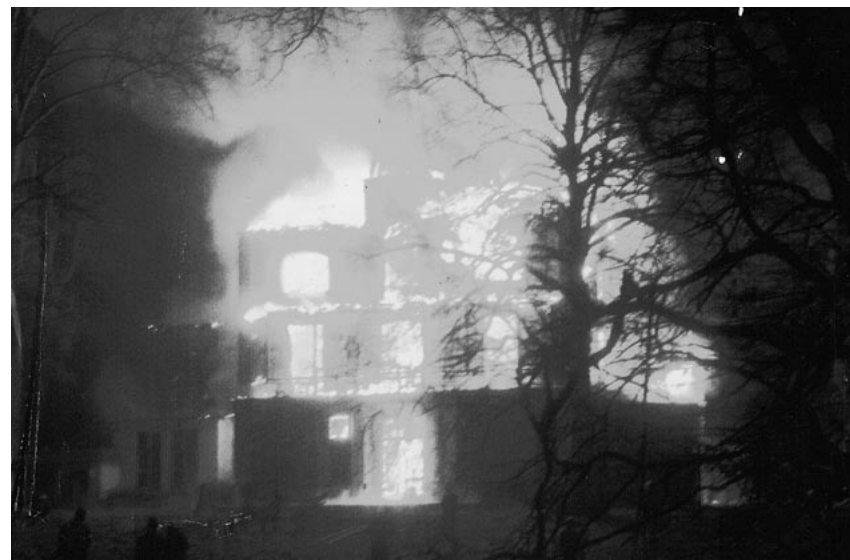
Brand in 1969

In de loop van de tijd ontwikkelde Kraaijbeek zich van opvangcentrum naar particulier bejaardenhuis met de mogelijkheden van gedeeltelijke tot volledige verzorging en verpleging. Omstreeks 1961 was het zo ver. Het hoofdgebouw werd ingericht voor permanente bewoning met een capaciteit van twintig tot dertig personen, het koetshuis werd gebruikt als pension en als gastenverblijf. Als inleggeld gold het toentertijd niet geringe bedrag van f 5000 (tegen 4% rentevergoeding), opvorderbaar bij vertrek of overlijden. De huurprijzen varieerden van f 200 tot f 300 per maand. Als beheerdersechtpaar fungeerden Stefan Lubienski en Nora Lubienski-van IJsselstein. In het hoofdgebouw Kraaijbeek werd ook de schoonmoeder van H.J. Witteveen uit Zeist ondergebracht, oud-minister van Financiën, oud-directeur van het IMF en voortrekker van de Soefi-beweging. In haar (zieken)kamer in het kurkdroge met hout gelambriseerde hoofdgebouw ontstond in december 1969 een felle brand, waarbij het pand tot de grond toe afbrandde. Zeven bejaarden kwamen in de vuurzee om. Een traumatische gebeurtenis voor de toenmalige brandweer.