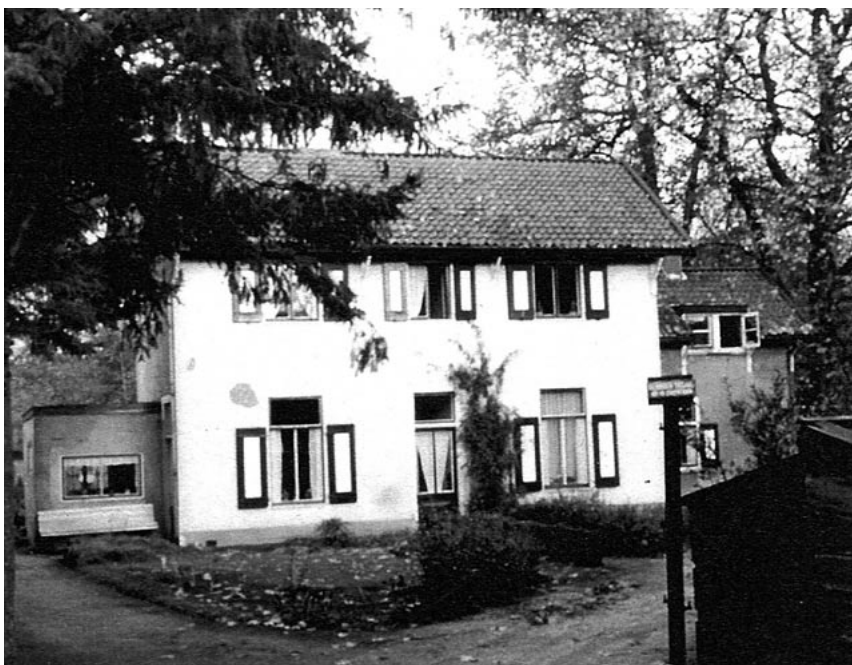
Het woonhuis als deel van het huidige koetshuiscomplex, 1979

De activiteiten Babyreform raakten op Kraaijbeek op de achtergrond. In de jaren '52-'53 werden ze omgevormd tot groothandel en begon men de detailhandelsactiviteiten af te stoten. De familie Land-Bonte verliet Kraaijbeek als woning en installeerde zich in de villa Emmalaan 6 (thans dokterswoning Bakhoven).