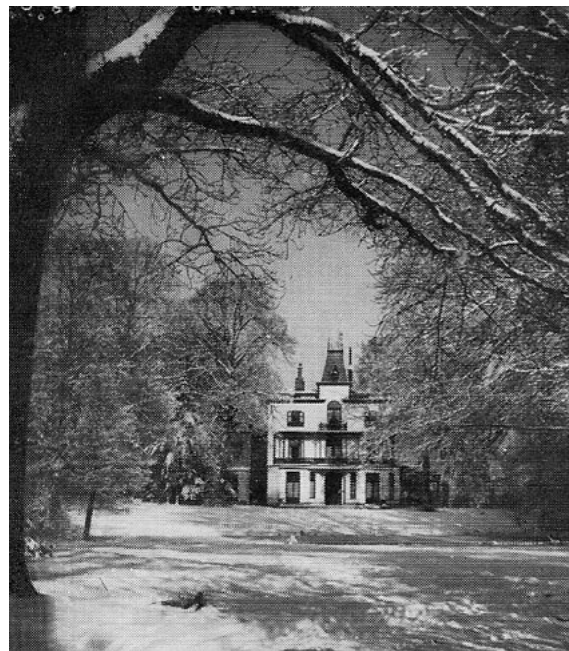
Huis Kraaijbeek in de periode Land-Bonte. De foto is beschadigd door de brand in december 1969

In juli 1946 vestigde het echtpaar (Addick) Land - (Mien) Bonte de bedrijfsactiviteit Babyreform in het huis Kraaijbeek, aanvankelijk in huur en later in eigendom (koopprijs fl. 170.000 of € 77.142). Het huis telde ongeveer 25 kamers. Verderop op het landgoed stonden nog een dienstwoning en een koetshuis, met daar tussenin een stal.