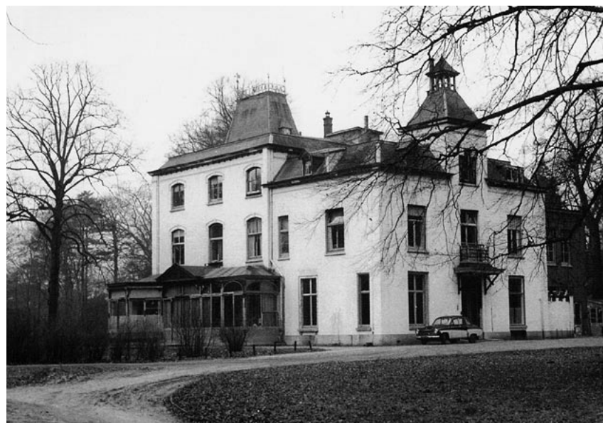
Huize Kraaijbeek (achterzijde) in de periode Land-Bonte