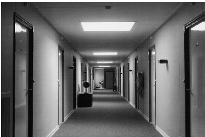
Middengang in het paviljoen